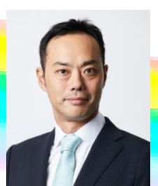
岩田関ト協担当委員長