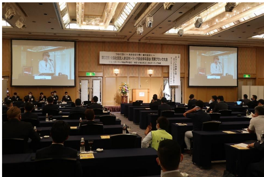
関東ブロック大会の様子(オンライン併用での開催)