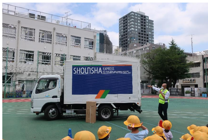
交通安全教室の様子