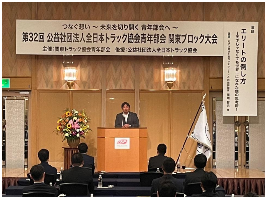
元プロ野球選手・野球評論家 里崎 智也氏の講演