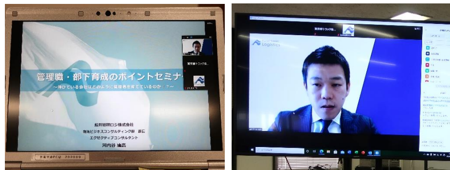
12月4日(金)に初リモート(Zoom)開催した青年部「青年経営者研修会」の様子