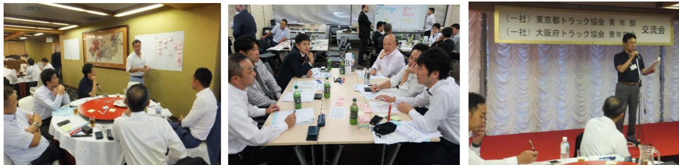
知識の向上と相互交流を目的として、他県の青年組織と合同で研修交流会を開催