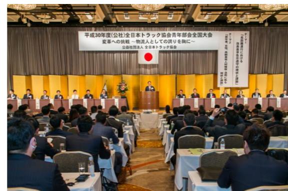
全日本トラック協会が開催する行事に参加し、全国の青年組織の仲間とのネットワークを広げる場として研修会・交流会へ参加しています。

〈お問い合わせ〉 〒160-0004東京都新宿区四谷三丁目1-8 一般社団法人東京都トラック協会 青年部事務局(教育研修部内) TEL:03-3359-4137 FAX:03-3359-6020