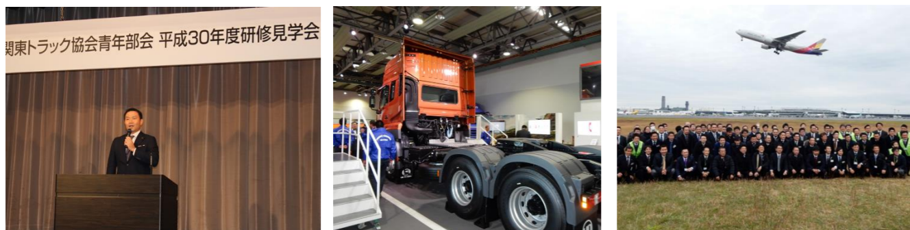
関東トラック協会青年部会では、毎年関東各県持ち回りで研修見学会を開催。関東各県の青年部会員同士で実際の現場等を視察・見学し、交流を図っております。