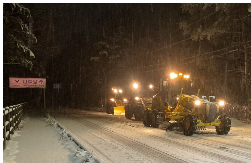
(令和6年2月29日 国道138号 山梨県山中湖村)