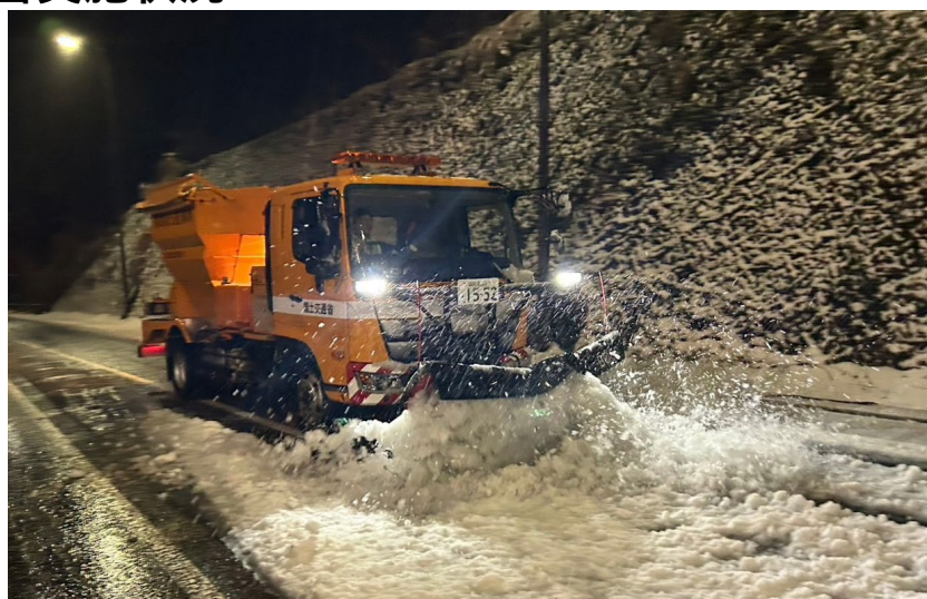
(令和7年3月5日 国道1号 神奈川県箱根町)