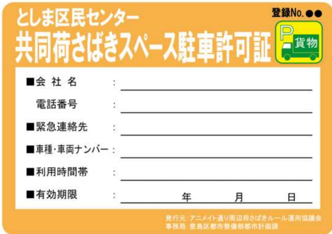
図－1 共同荷さばきスペース駐車許可証（例）