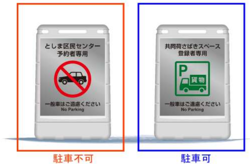
図ー２ 共同荷さばきスペース看板（例）