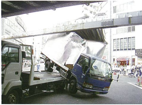
仲原街道ガード 八ツ山通り