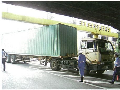
呉服橋ガード 国道1号永代通り