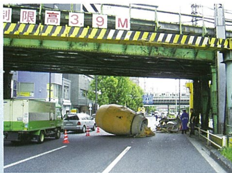
小柳橋ガード 靖国通り