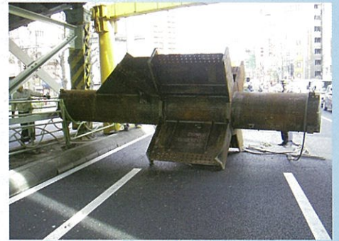
万世橋ガード 中央通り