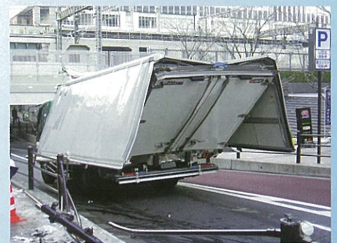
明神坂ガード 神田明神通り