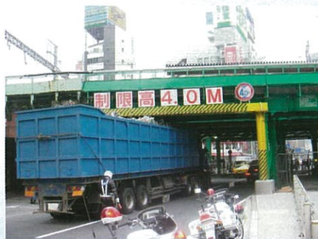
二葉橋ガード 外堀通り