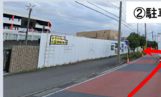
② 駐車場入口付近の様子

② (仮設) 殿町夜光線沿線(入江崎水処理センターとかわさき南部斎苑との間) P ① ② 【住所】 【約38台分】 神奈川県川崎市川崎区夜光3丁目2 【期間限定】 R5.11.9(木)～R6.3.8(金) ※年末年始(R5.12.28(木)～R6.1.4(木)) 利用不可