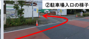
② 駐車場入口の様子