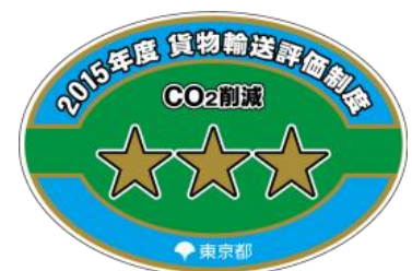
ロゴマークイメージ

車種・重量等に応じて設定した 52 区分の評価基準により、各事業者の全車両ごとの実走行燃費の偏差値を算出し評価します。審査の結果、評価を取得した事業者には平成 28 年 7 月頃、一つ星から三つ星の評価証明書を交付します。