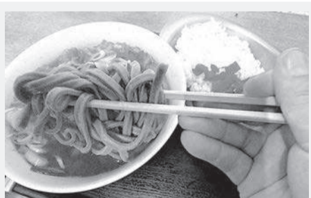
立ち食いそばのヒミツ

④おわりに 運送業界では、現状の労働環境のままでは人材不足が今後さらに深刻化する懸念があります。その対応策の一つとして、女性活躍推進法の趣旨に沿い、女性の特性に配慮した労働環境や労働条件を整備することで、女性が働きやすい職場づくりを進めていくことが求められます。