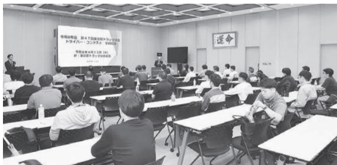
府中市の警視庁府中運転合会館で開催する。東ト協ドラコンは、会員事業者の都内営業所に所属する営業用トラックドライバーを対象に、関係法令や安全運転、交通公害防止、エコドライブなどに関する知識・技能の向上を図り、「都民に信頼されるプロドライバー」としての意識高揚」を目的に開催している。