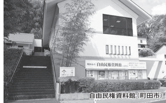
自由民権資料館(町田市)

「自由」という有名な言葉が自然に思い起こされる。この言葉は、1882(明治15)年4月6日、岐阜での演説後に、板垣が暴漢に襲われた際に発したとされるもの。自由民権運動を全国に広げようとしていた最中の出来事だった。 祇園寺のアカマツは1908(明治41)年9月、秩父事件など自由民権運動の殉難者を弔う法要に合わせて植えられた。板垣をはじめ、自由党の指導者ら1000人余りが甲州街道に馬車を連ねて集い、法要後の演説会の記念として、板垣自らが苗木2本を植えたという。当時の住職・中西悟玄は、地方紙「週刊多摩新聞」の発行や青年会の指導、三多摩地区農家への養豚の推奨など地域活動に尽力するとともに、自