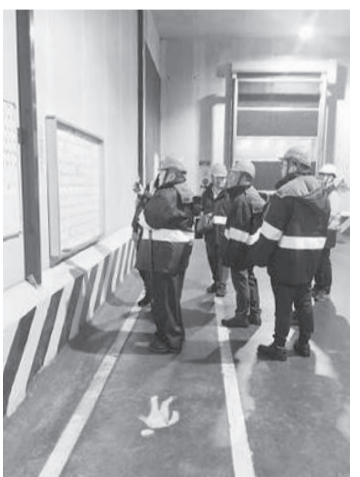
東ト協 ロジ研海外交流事業 7年度