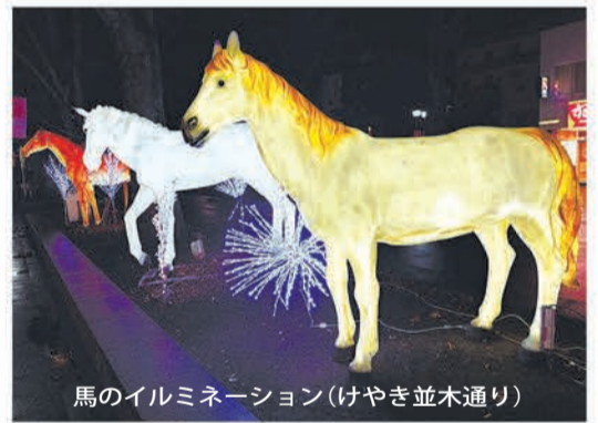
馬のイルミネーション(けやき並木通り)

都内で「馬」に関わる神社となると、千束八幡神社(大田区)、矢先稲荷神社(台東区)、神田神社(神田明神・千代田区)、五方山熊野神社(葛飾区)などが挙げられる。あわせて、約1900年前に創建された武蔵国の総社として知られる大國魂神社(府中市)も、馬とは古くから深いつながりがある。かつて、武蔵国では馬の飼育が盛んで、朝廷に献上された馬も多くいたという。広大な大地と豊かな水源に恵まれ、飼育には最適な環境だった。同地の古墳からは、豪華な馬具が多数出土していることから、馬の飼育は古墳時代までさかのぼることができる。馬は輸送機能だけでなく、当時の支配者の権力を象徴するものでもあったことがうかがえる。また、武士の時代には戦いにおいて重要な役割を担い、農耕にも用いられ、馬市も盛んに行われていた。