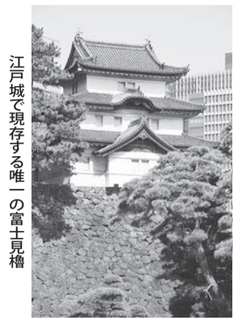
江戸城で現存する唯一の富士見櫓

花見本番を迎えるとなると、風物詩の「場所取り」がにぎやかになる。ワイワイとやるのも楽しいが、この時期ならではの場所(特別公開など)で見る見られない・入れない場所などでも楽しみたい。