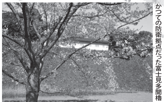
かつての防衛拠点だった富士見多聞櫓

富士見櫓の後ろに行くと、左手に見えるのが富士見多聞櫓。多聞とは武器や食糧などの倉庫で、戦時には鉄砲や弓などを放つ足場となり、敵情を視察する物見台の役割を持つ長屋造りの櫓のこと。江戸城本丸には15棟の多聞があったが、現存するのはこの富士見多聞櫓だけ。堀から多聞まで高さ約20mの石垣があり、防衛拠点であったことが分かる。