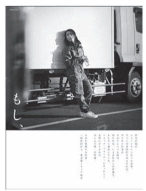
女性ドライバーの活躍を求める

また、シリーズ広告を 通じて、トラックドライ バーは日本を復興する仕 事であることをアピール し、その重要性を訴えか けている。 なお、広告第3回目は 3月下旬に掲載予定。