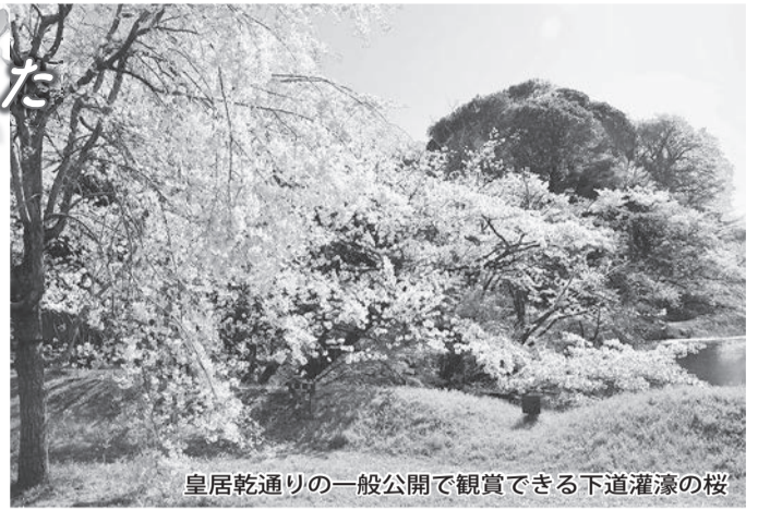
皇居乾通りの一般公開で観賞できる下道灌濠の桜

暖気と寒気のせめぎ合いもそろそろ決着の頃だ。桜の季節が間近になり開花を迎える。梅は匂いよ木立はいらぬ」と梅は香りで春の到来を告げるが、桜はその盛りの姿が人を惹きつけ、春を実感させる。いよいよサクラ(ソメイヨシノ)の開花宣言が各地から届くようになってきた。