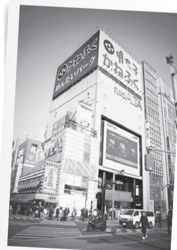
新宿のランドマークに別れ

東京の中枢を担う副都心の玄関口として交通、商業、娯楽施設が集まる新宿駅周辺。駅の1日の乗降客数は340万人を超え、西口駅構内は再開発が進み、商業圏としてにぎわいと、それぞれのエリアで特徴を持つ。新宿駅の待たファッショニブル「新宿アルタ」(写真)が閉館した。1980(昭和55)年の開業以来、45年の歴史に幕を下ろした。かつて「西口交番」、東口は「アルタ」というのが定番だった。新宿駅の利用者数は、世界に類を見ない規模だが、一方で人流の変化も出てきている。年間小売販売額の減少、昼間人口の減少といった傾向が見受けられ、活力の低下が情報発信地であった。 懸念されている。先月末日をもって、親しまれたファッショニブル「新宿アルタ」(写真)が閉館した。1980(昭和55)年の開業以来、45年の歴史に幕を下ろした。かつて「西口交番」、東口は「アルタ」というのが定番だった。新宿駅の利用者数は、世界に類を見ない規模だが、一方で人流の変化も出てきている。年間小売販売額の減少、昼間人口の減少といった傾向が見受けられ、活力の低下が情報発信地であった。 2月28日、20時30分をもって閉館した新宿アルタの幕引きは、長年同ビルスタジオで収録された番組の「いいとも!」の掛け声で、笑ってさようならを告げたのもアルタらしい。時代のトレンドを牽引した、新宿のランドマークが消えた。 以前は、三越が出資した「三幸食品店」が位置し、後の三越伊勢丹主導で衣料、雑貨店がテナントとして入っていた。2005(平成17)年からは全店舗が女性向けテナントとして確立され、今日に至った。時代とともにテナントの入れ替えが行ってきたアルタも、昨年3月21日に閉館を発表。近年のコロナ禍での客離れや、周辺の商業施設との競争激化が影響し、営業赤字が続いていたという。