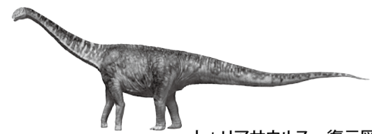
トウリアサウルス 復元図

近頃、地球がおかしい。かなり前から皆が気付いていたことだが、2011(平成23)年の東日本大震災以来、一層、顕著になってきた。