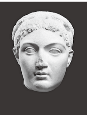
《クレオパトラ》ブトレマイオス朝時代(前1世紀中頃) トリノ古代博物館蔵

鼻低民族の人間として考えにくい話だが、残された彼女の彫像のほとんどが、鼻が欠けているのは、彼女の彫像の鼻が欠けているのは、その後の大地震のせいなのか、敗れた国は徹底的に破壊される当時のしきたりのせいなのか、謎は多い。