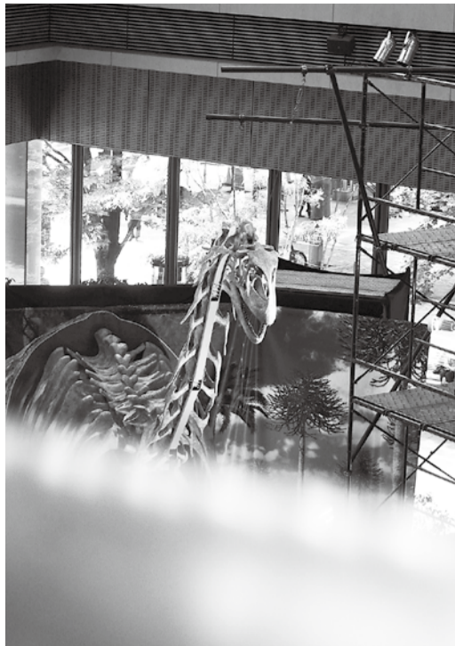
丸の内に恐竜が出現？