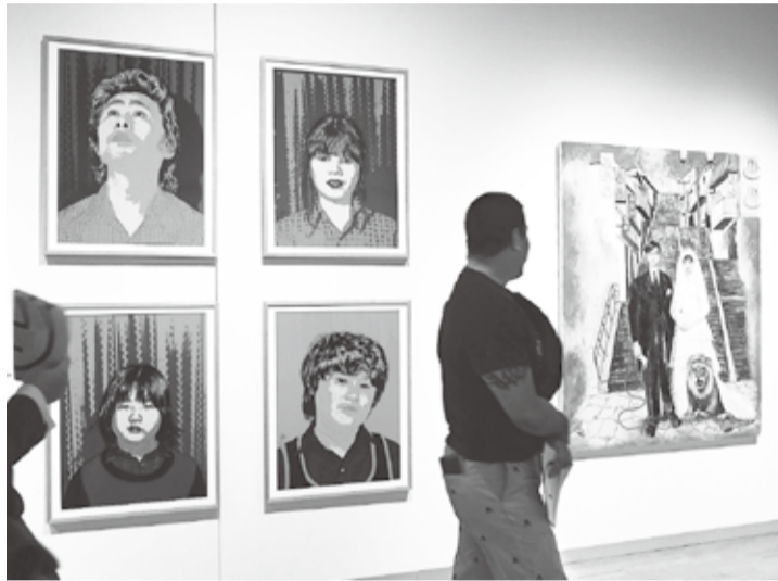
家族の肖像。右は『赤い糸』 ◎ オリジナルM-D-E-M5 M.スイコーデジタル12-50ミリ