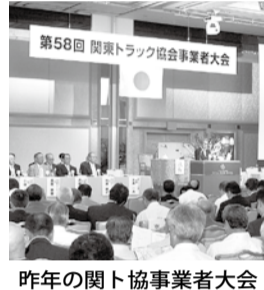
昨年の関ト協事業者大会

まえ、今年度の事業者大会では、関東1都7県のトラック運送事業者がさらに事故防止の徹底を図るため、新たな試みとして「関東プロック事故防止大会」を実施することになっている。なお、事業者大