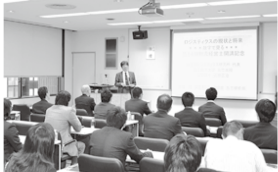
第14期の物流経営士課程

東京都トラック協会 管理職の経験3年以上、第15期物流経営士課程の受講生を募集する。募集期間は8月18日から9月30日まで。 開講式は10月22日。講座を修了し試験に合格した者に対しては、全日本トラック協会認定の「物流経営士」資格が授与される。 【募集要領】は次の通り。 【受講資格】東ト協および関東トラック協会の会員事業者、またはその社員で、経営