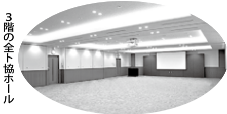
3階の全ト協ホール

2階に研修室を設けた。これらの施設は、業界の次代を担う人材の育成などに活用されることとなる。 新会館はまた、東日本大震災を教訓として、災害発生時には全国の緊急物資輸送などをコントロールする中央司令塔としての機能を説明し、「全ト協の防災センターとして、国の防災司令塔として、暮