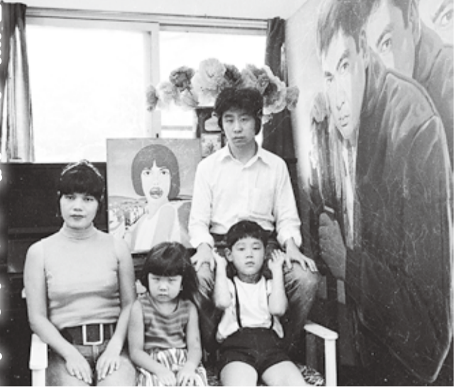
横尾さんは『家族狂』という本を制作したこともある。 ◎ ニコフ ニッコール50ミリ