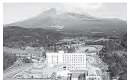
▲グリーンピア大沼