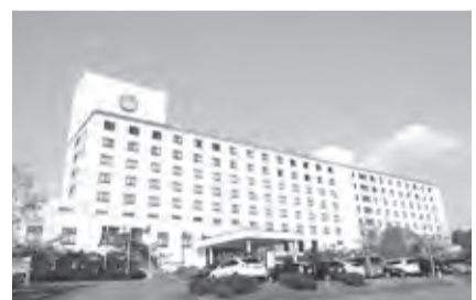
▲ダイワロイヤルホテルズ (みなみ北海道鹿部ロイヤルホテル)