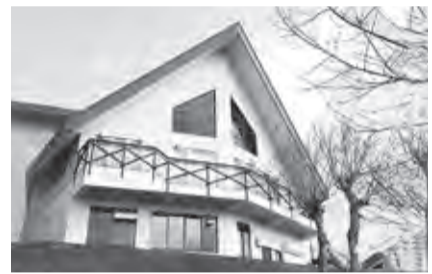
▲クレストビュー菅平