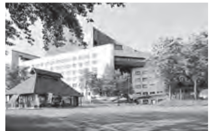
▲ニュー・グリーンピア津南