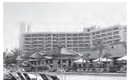
▲東急ホテルズ(宮古島東急リゾート)