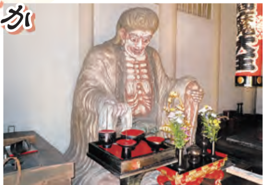
⑤閻魔様(木造):総高5.5メートル。文化11(1814)年頃に製作されたと推定され、都内でも最大級の像。 ⑥奪衣婆(木造):総高2.4メートル。明治3(1870)年の製作と伝えられる。衣を剥ぐことから、内藤新宿の妓楼の商売神として信仰されたという。

るぞ」といえば、マイナス評価が残るといふ、脅しにも使われたものだ。 そうしたことを知っている人はどれくらいいるだろうか。おそらく閻魔帳については60歳代以降ぐらいたらう。 仏教では世界を十界に分ける。迷界の六界と悟界の四界。六界には地獄、餓鬼、畜生、修羅人間、天上の各界で、常に輪廻しているといわれている。このうち地獄の主人公として知られているのが閻魔様。この六界から