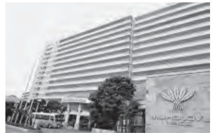
▲マホロバ・マインズ三浦