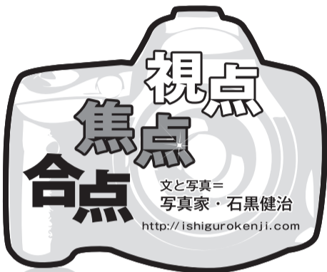
文と写真=写真家・石黒健治 http://ishigurokenji.com

さつきからぼくたちの方をずっと見ながら、後を付けてきていた初老の男がいた。黒ラシャの厚ぼつたいコート、黒い帽子。目が合うと近づいてきた。