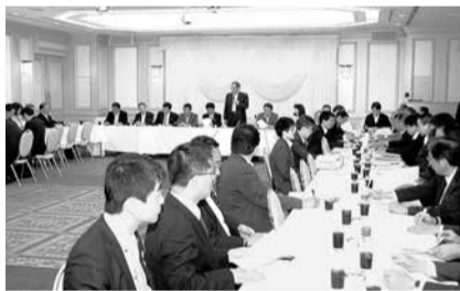
許要件の見直し(普通免許)