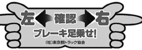
運転者注意喚起ステッカー

て左右の安全確認の徹底や、万一時報にも事故を回避できるように「ブレーキ足乗せ」の励行を呼びかけ、注意を促していく方針だ。しかし、事故防止には、これといった「決め手」と