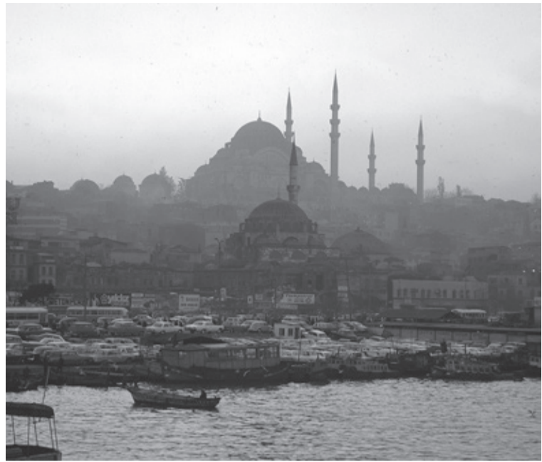
ハッセルブラッド 500C プラナー80ミリ、ライカM4 ズミルックス35ミリ

日暮れとともにモスクから流れるコーランの声。ラマダンの一日が終わり、いっせいに食卓に着く。